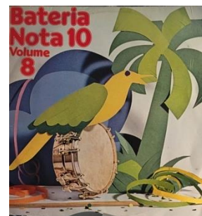
Figura 9 – capa do álbum Mocidade Independente de Padre Miguel - Bateria Nota 10 Volume 8 (1982)