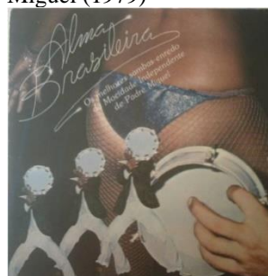
Figura 7 – capa do álbum Alma Brasileira Os Melhores Sambas-Enredo Da Mocidade Independente De Padre Miguel (1979)