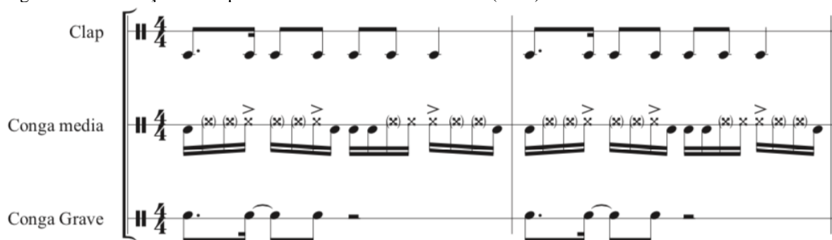
Figura 4 – Transcrição do loop 2 da música Ritmo de Macumba (1971)

Fonte: álbum Escola De Samba Da Cidade – Batucada N° 3 "The Exciting Rhythm Of The Wild Brazilian Carnival" (1971)