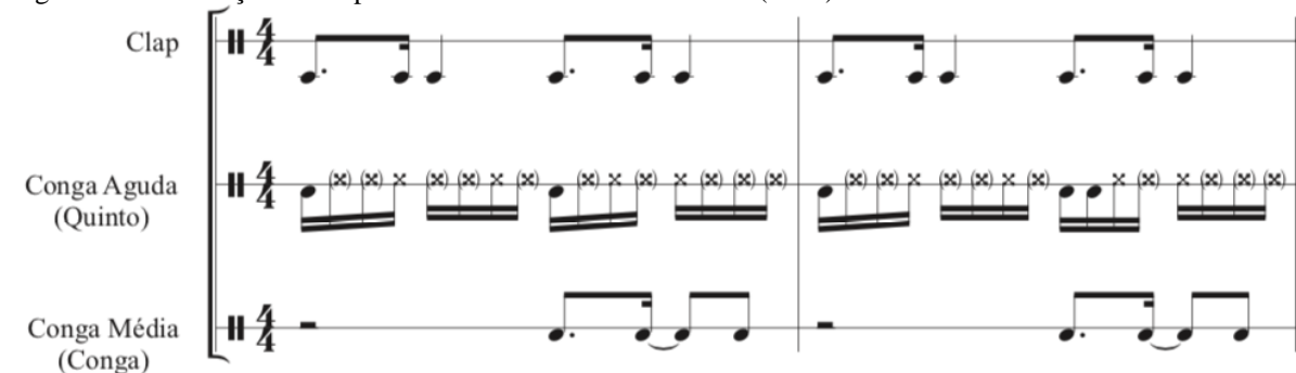
Figura 3 – Transcrição do loop 1 da música Ritmo de Macumba (1971)

Fonte: álbum Escola De Samba Da Cidade – Batucada Nº 3 "The Exciting Rhythm Of The Wild Brazilian Carnival" (1971)