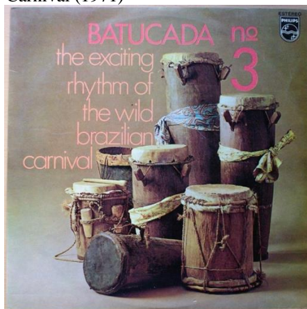
Figura 5 – capa do álbum Batucada No. 3 The Exciting Rhythm of the Wild Brazilian Carnival (1971)