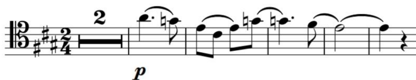
Figura 8 – Proposta de edição. As notas foram grafadas mais para o centro do pentagrama.

Em alguns trechos o compositor escreve pequenas ligaduras, mas na maior parte faz imensas ligaduras de frase, o que mostra com clareza o início e fim desta. Porém, deixa muitas dúvidas a respeito de como frasear cada frase musical. Buscou-se uma maneira de ligar as notas de forma que não distorcesse a ideia de um som contínuo e bem legato ao ligar poucas notas, o que torna mais livre o movimento do arco. As novas ligaduras dão, também,