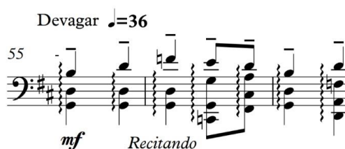
Figura 4 – proposta da edição

Ainda na parte B, entre os compassos 75 e primeiro tempo do 91, onde há cordas duplas em terças, houve uma necessidade de modificação: ao invés do violoncelista necessitar pensar em oitavar as notas, o que não é tão comum na escrita do repertório do instrumento, é sugerida a mudança da clave de Fá para a de Sol, para posicionar as notas em uma sonoridade real na escrita da partitura e conseqüentemente, trazê-las também para o meio do pentagrama. Isso facilitaria a leitura, principalmente a de primeira vista, e pode dar mais segurança na hora da interpretação. Basta que o intérprete domine a leitura da clave de Sol, algo bastante comum na literatura do violoncelo.