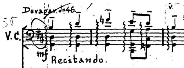
Figura 3 – Manuscrito. Comp. 58 do primeiro movimento

feitas pelo compositor no nordeste brasileiro (VIEIRA, 2006, p. 32). Entretanto, como o violoncelo necessita realizar diversos acordes arpejados de três e quatro notas, existe um pequeno atraso para executar a voz superior, devido a realização das notas inferiores de forma arpejada, o que toma tempo desta melodia e acaba por não deixar a voz superior ser “cantada” ou como a própria indicação do manuscrito sugere: “Recitando”. Para solucionar este problema da clareza da melodia, é sugerida troca indicação metronômico para 36 pulsos por minuto. Mais devagar do que a sugestão de tempo do manuscrito, assim a melodia do aboio pode ficar mais evidente e possibilitaria que os acordes arpejados sejam executados com mais volume sonoro, mas sem deixar a parte B lenta demais.