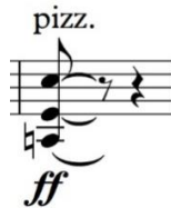
Figura 2.1 – Alteração proposta no comp. 36

vibrar juntamente com as cordas do piano, o que reforçaria a ligadura que leva para uma pausa, indicação que pode ser interpretada como um comando para deixar as notas vibrarem, sem abafá-las ou interromper o som de forma abrupta. Esta alteração deixa permanente a ideia do modalismo já citado que é muito importante na obra de Siqueira. Desta forma, é sugerido o sinal de bequadro em todas notas Dó do compasso 36, tanto do piano quanto do violoncelo.