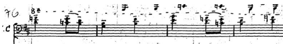
Figura 5 – Comps. 76 a 79 do manuscrito.

Ainda na parte B, entre os compassos 75 e primeiro tempo do 91, onde há cordas duplas em terças, houve uma necessidade de modificação: ao invés do violoncelista necessitar pensar em oitavar as notas, o que não é tão comum na escrita do repertório do instrumento, é sugerida a mudança da clave de Fá para a de Sol, para posicionar as notas em uma sonoridade real na escrita da partitura e conseqüentemente, trazê-las também para o meio do pentagrama. Isso facilitaria a leitura, principalmente a de primeira vista, e pode dar mais segurança na hora da interpretação. Basta que o intérprete domine a leitura da clave de Sol, algo bastante comum na literatura do violoncelo.