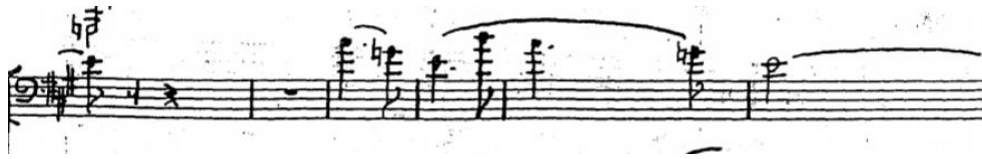
Figura 9 – compasso 33 a 38 do manuscrito. Exemplo da grande ligadura entre o compasso 36 e 37.

uma liberdade maior ao intérprete para escolher a arcada que desejar ou que considera a melhor.