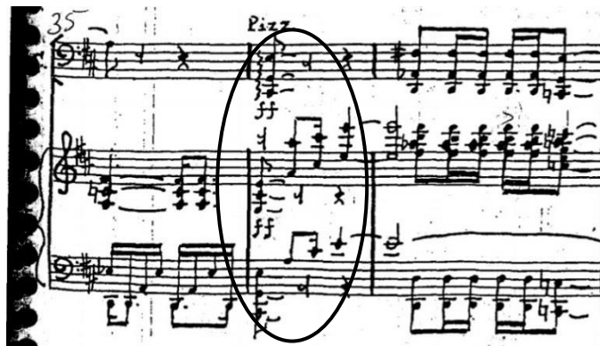
Figura 2 – Comps. 35 a 37.

No compasso 36, o sinal de bequadro não se encontra mais na nota Dó, tanto no piano, que possui um material melódico distinto do compasso 36 até o 44, quanto no violoncelo, que faz uma base bem ritmada em forma de acordes não arpejados. Entre os compassos 45 e 54 o violoncelo faz a mesma melodia que ora o piano fazia enquanto este realiza os acordes bem ritmados que aquele realizava, entretanto no compasso 45 o violoncelo, que faz a mesma melodia que o piano havia feito, a nota Dó aparece com o sinal de naturalização ou bequadro, o que indica a permanência do modo de Ré mixolídio ou I M.R. com centro em Ré. Se comparamos os compassos 36 e 45, o material melódico do piano (compasso 36) e do violoncelo (compasso 45) são os mesmos. Vale ressaltar que o movimento é composto em sua maior parte no modo Ré mixolídio ou modo I M.R. com centro em Ré, e ao contrário do compasso 45 que mantém esse modalismo, o compasso 36 foge da ideia modal ao realizar um acorde de quinto grau de Ré maior.