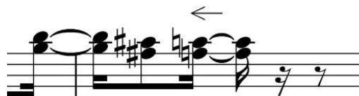
Figura 11 – Compasso 76 do violoncelo que precede a sessão “O Canto em relevo”.

Assim como no segundo movimento, no terceiro não houve a necessidade de grande intervenção, apenas no trecho onde pode ser considerado de coda , onde são misturados os materiais que o compositor utilizou ao longo da obra: o piano realiza uma melodia em ritmo de coco enquanto que o violoncelo faz um aboio arpejado muito similar ao que há na parte B do primeiro movimento. Se considerarmos a marcação metronômica no manuscrito de semínima a 96 batidas por minuto, ficaria muito rápido para o violoncelista executar a voz superior que caracteriza o aboio com os acordes arpejados, entretanto não se pode tocar tão lento como no primeiro ou no segundo movimento, pois pode descaracterizar a melodia em ritmo de coco que o piano faz, que é a mesma que o violoncelo fazia anteriormente neste movimento. Um meio termo poderia ajudar na interpretação, então se optou por um compasso antes de começar a sessão “O Canto em relevo”, em pôr apenas uma seta em direção para a esquerda, que indica um pequeno atraso na pulsação do trecho. Recomenda-se este atraso na pulsação, mas não em demasiado, para não distorcer a obra, e sim para dar mais espaço de tempo para o violoncelista executar os arpejos com a melodia da voz superior que imita um aboio. Este é um trecho muito importante, pois o violoncelista e o pianista necessitam entrar em um acordo qual pulsação seria mais adequada para ambos.