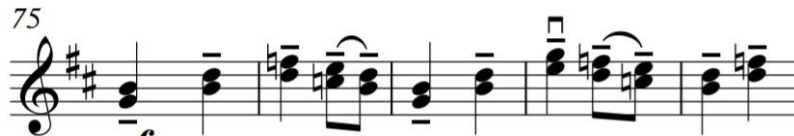
Figura 6 – Comps. 75 a 79 da edição.