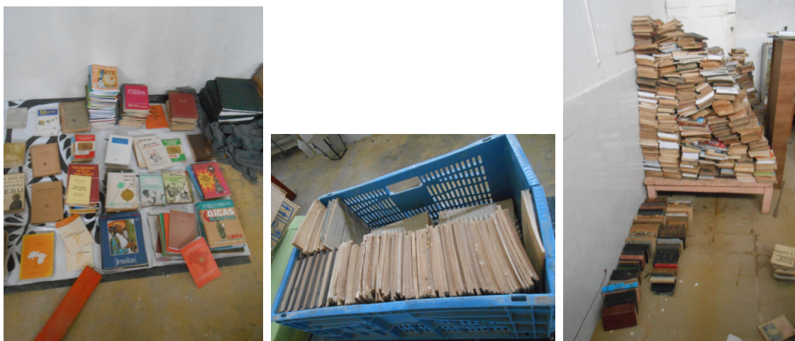
Figura 4 – Situação do acondicionamento do acervo bibliográfico ao tempo da pesquisa.