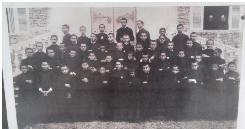
Figura 3 – Fotografia dos apostólicos (estudantes) na década de 1940 presente no Mosteiro dos Jesuítas.