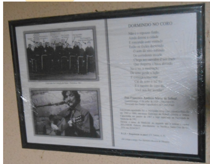
Figura 1 – Imagem e poema de Belchior presentes no convento capuchinho de Guaramiranga