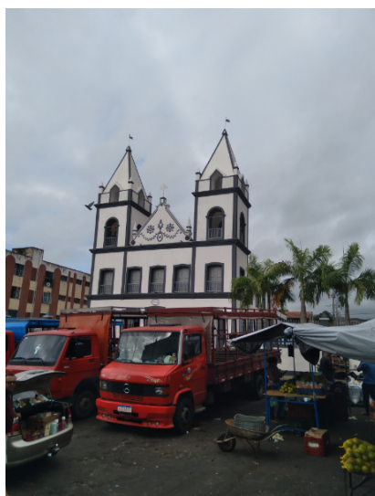
Figura 2 – Meio de transporte utilizado para o deslocamento entre Baturité e Guaramiranga. Ao fundo, a capela de Santa Luzia, do último quartel do século XIX.

Uma vez em campo, o deslocamento dentro das cidades é feito, quase sempre, a pé, mas em caso de territórios muito grandes, de transporte público oficial ou alternativo, transporte por aplicativo (muito raro fora das capitais) ou táxi. Já o transporte entre as cidades é realizado, via de regra, de ônibus, podendo ocorrer ainda o uso do transporte alternativo (lotações), de barcos e outros. Uma peculiaridade na região foi o uso do pau-de-arara, caminhão com madeiras dispostas paralelamente na carroceria, que serve para o transporte de pessoas e de mercadorias. No ponto final do pau-de-arara, em Baturité, se encontra a Igreja de Santa Luzia, inaugurada em 1879, que também foi pesquisada (Fig. 2).