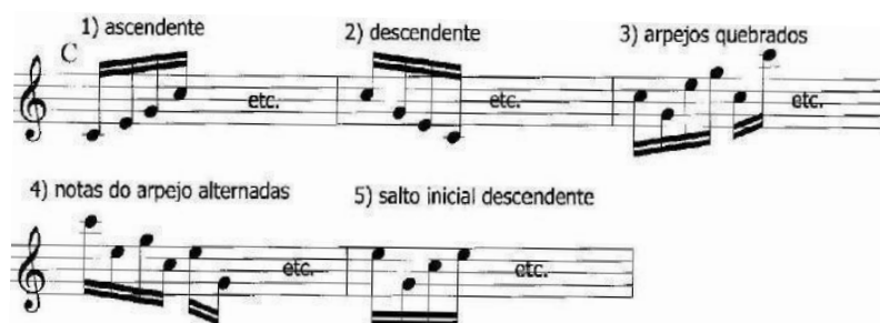
Figura 2 – Classificação dos arpejos