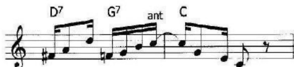
Figura 8 – Exemplos de antecipação

Fonte: A estrutura do choro (ALMADA, 2006, p. 32)