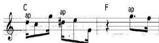
Figura 6 – Exemplos de apogiatura