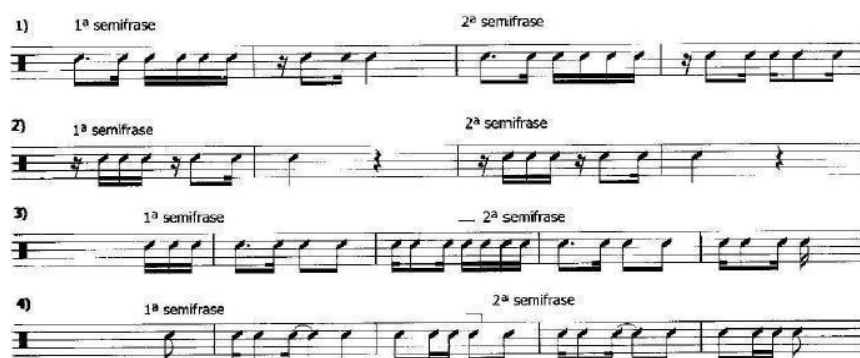
Figura 3 – Semifrases estruturadas

Fonte: A estrutura do choro (ALMADA, 2006, p. 17)