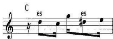
Figura 7 – Exemplos de escapada por salto