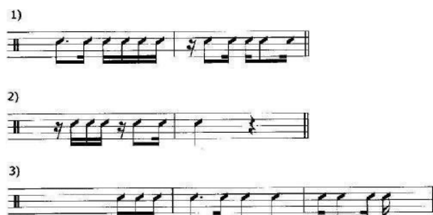
Figura 4 – Configuração rítmica básica do choro