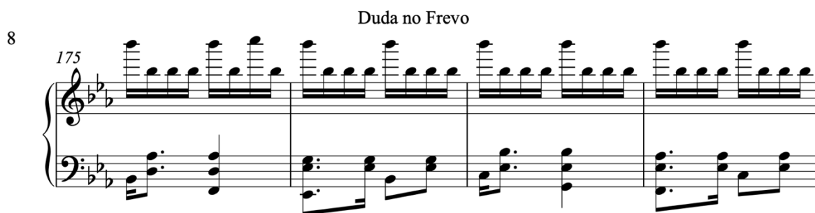
Figura 05 - Trecho do arranjo de Duda no Frevo inspirado em La Campanella de Liszt.