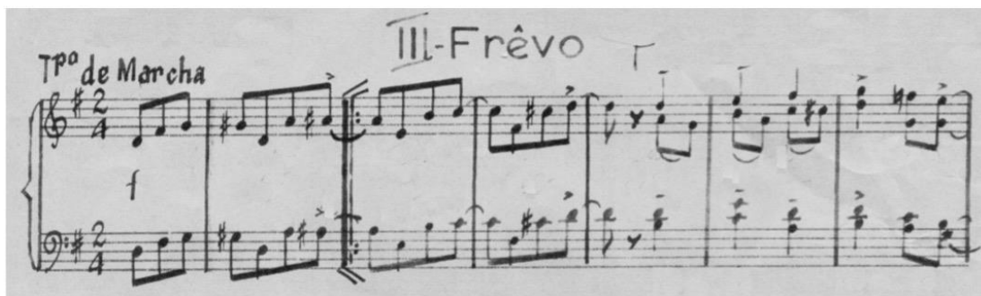
Figura 03 - Frevo, Suíte infantil n.º3