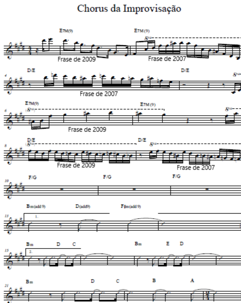
Figura 1 – Chorus da improvisação com os exemplos de frases

Para analisar o fraseado de Holdsworth, transcrevemos frases específicas de dois improvisos em performances recentes, uma de 2007 e outra de 2009. Adicionamos as frases dentro de um chorus 1 para exemplificação.