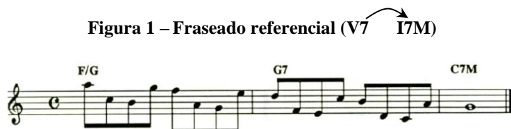
Figura 1 – Fraseado referencial (V7 → I7M)

Quando os discentes demonstraram certo domínio na execução dos elementos básicos (shapes, padrões de arpejos e digitações dos modos), apresentei modelos de frases, digitações referenciais, a partir dos quais fosse possível adentrar na esfera da improvisação. As frases foram utilizadas de modo que os alunos percebessem as “sensações harmônicas” fundamentais (tônica, dominante e subdominante). As frases referenciais utilizadas foram elaboradas por mim de modo instantâneo, ou prévio, com base em autores e artistas como Nelson Faria, Ian Guest etc. Por este modelo, os alunos passam a criar com certa facilidade, dirimindo o medo de execução e participação nas aulas. As Figuras 1 e 2 apresentam dois dos fraseados referenciais utilizados nesta seção do curso de guitarra elétrica, com os alunos A , B , C e D .