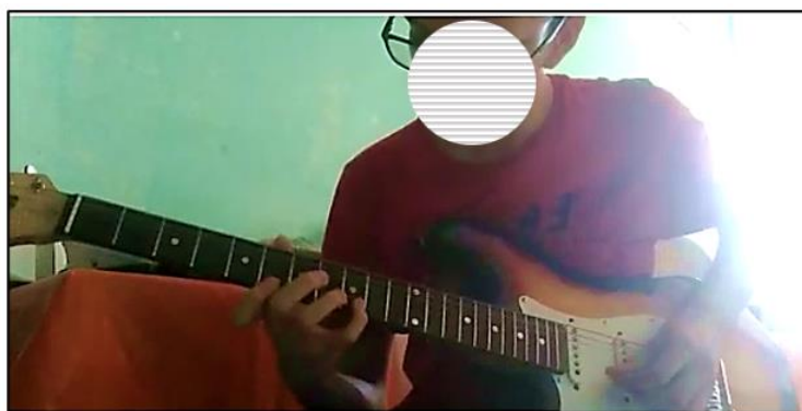
Figura 5 – Aluno D improvisando em looping sobre a base harmônica de “Blue Bossa” (Vídeo: 1’39’)