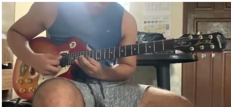
Figura 4 – Aluno B improvisando em looping sobre a base harmônica de “Blue Bossa” (Vídeo: ~14’)

elementos melódicos propostos. As Figuras 4 e 5 a seguir, apresentam um print de um dado momento dos vídeos enviados pelos alunos B e D .