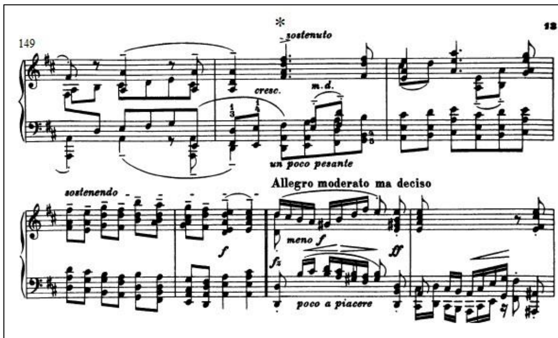
Figura 1 – Compassos 149-155 do texto estudado.

Para apresentar alguns resultados parciais da pesquisa, se parte de um pequeno trecho do texto musical estudado (Figura 1), apontando algumas questões que surgiram no processo de estudo e refletindo sobre a maneira como dialogam com um contexto mais geral.