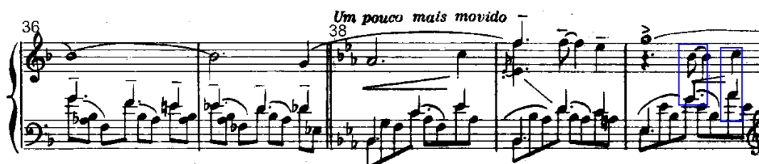
Exemplo 2 – Início da seção B (compasso 38), maior independência entre as vozes. Edição Ricordi 1955.

Nesse sentido, é na seção B da peça que o adensamento polifônico se sobressai. Como mostra o exemplo 2 abaixo, os acordes se apresentam em forma de arpejos e as vozes se mostram mais evidentes e com maior independência. Nessa nova seção o barítono faz o preenchimento harmônico e o tenor e contralto trazem melodias que enriquecem a polifonia. Apresentam um caráter folclórico pois formam as “terças caipiras” 5 que são um recurso comum na música do interior paulista.