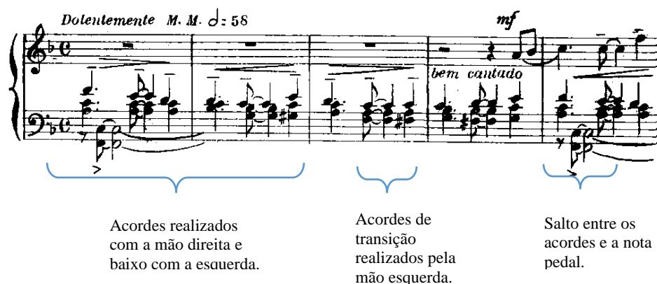
Exemplo 5 – Implicações da execução dos acordes e da linha do baixo (comp. 1 ao 5). Edição Ricordi 1955.

surgiu: realizar o salto para a linha do baixo (terceiro plano) sem que o acorde do segundo plano soasse em staccato .