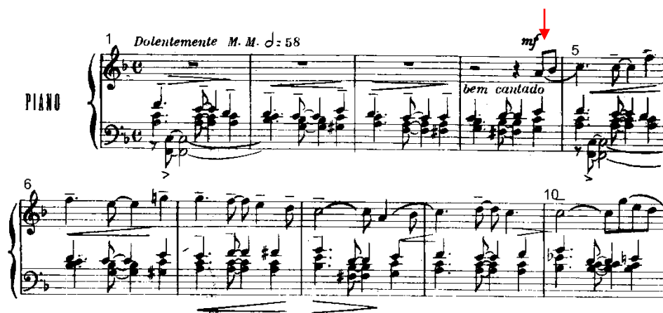
Exemplo 3. Seção A: o estudo do legato no primeiro plano, melodia da mão direita (comp. 5 a 10).

Nesse sentido, para a execução do bem cantado descrito por Guarnieri na partitura, o toque legato foi, dentre os vários tipos de toques pianísticos, o escolhido para a execução do primeiro plano da peça. Com ele busquei o domínio preciso da ligação entre os sons da melodia principal. Tomando o exemplo 3 a seguir, com ênfase no início do primeiro plano no compasso 5, apenas quando toco a nota si bemol é que relaxo e elevo o dedo da tecla anterior (lá) e assim, sucessivamente, nota por nota.