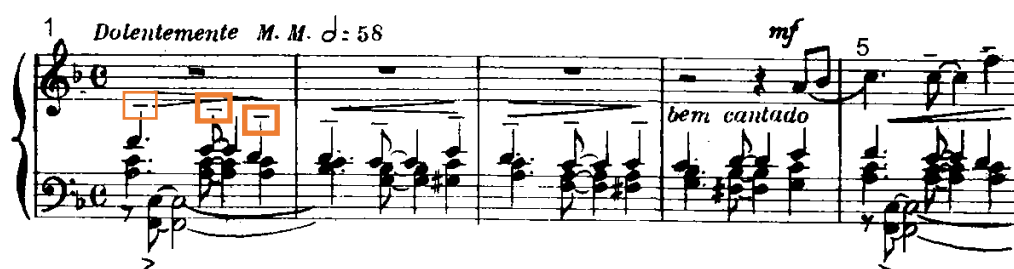
Exemplo 4. O direcionamento das hastes e o tenuto (comp. 1 ao 4). Edição Ricordi 1955.

Sobre o estudo do segundo plano da seção A, como mostra o exemplo 4 abaixo, Guarnieri deixa claro a existência de uma melodia apresentada de forma acordal, realizada pela mão esquerda. Isso é mostrado pelo direcionamento das hastes das figuras e pela escrita do tenuto nas notas mais agudas dos acordes. É necessário que a voz executada pelo dedo polegar seja tocada com maior intensidade que as outras duas, respeitando o contorno melódico também direcionado pela harmonia. Para a execução desse trecho e dos outros semelhantes, trabalhei a voz, separadamente, com o objetivo de dá-la um sentido melódico. Ressalta-se que essa linha melódica se apresenta como uma contra melodia ao primeiro plano já mencionado.