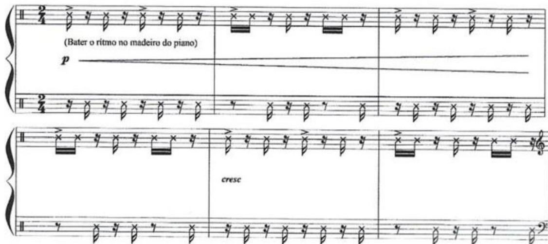
Figura 1 – Partitura do início da música tocada na madeira do piano. Exemplo de síncopes e do ostinato no Sambinha. Comp. 1 – 6.

Fonte: SOARES, C. Sambinha: da "Suíte Juvenil" para Piano, samba, Dó maior; piano. Belo Horizonte: Minas de Som, 2020. Partitura. 3 págs. Disponível em: http://musica.ufmg.br/selominasdesom . Acesso em: 28 de Jun. de 2022.