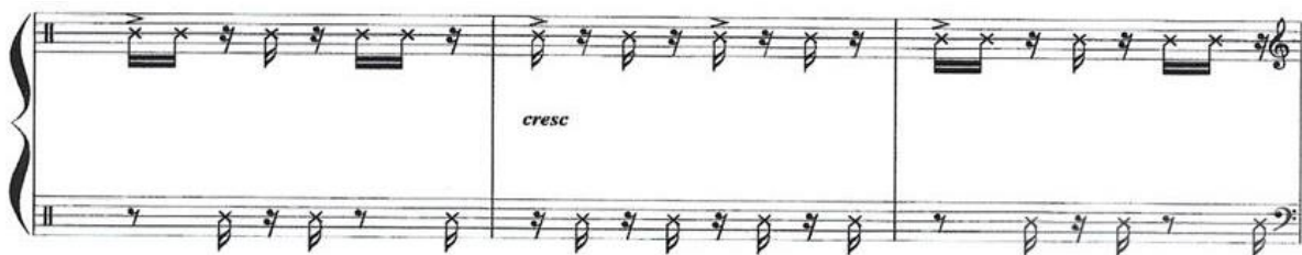
Figura 5 – Exemplo de referência ao reco-reco no Sambinha. Compassos 4 – 6.

Fonte: SOARES, C. Sambinha: da "Suíte Juvenil" para Piano, samba, Dó maior; piano. Belo Horizonte: Minas de Som, 2020. Partitura. 3 págs. Disponível em: http://musica.ufmg.br/selominasdesom . Acesso em: 28 de Jun. de 2022.