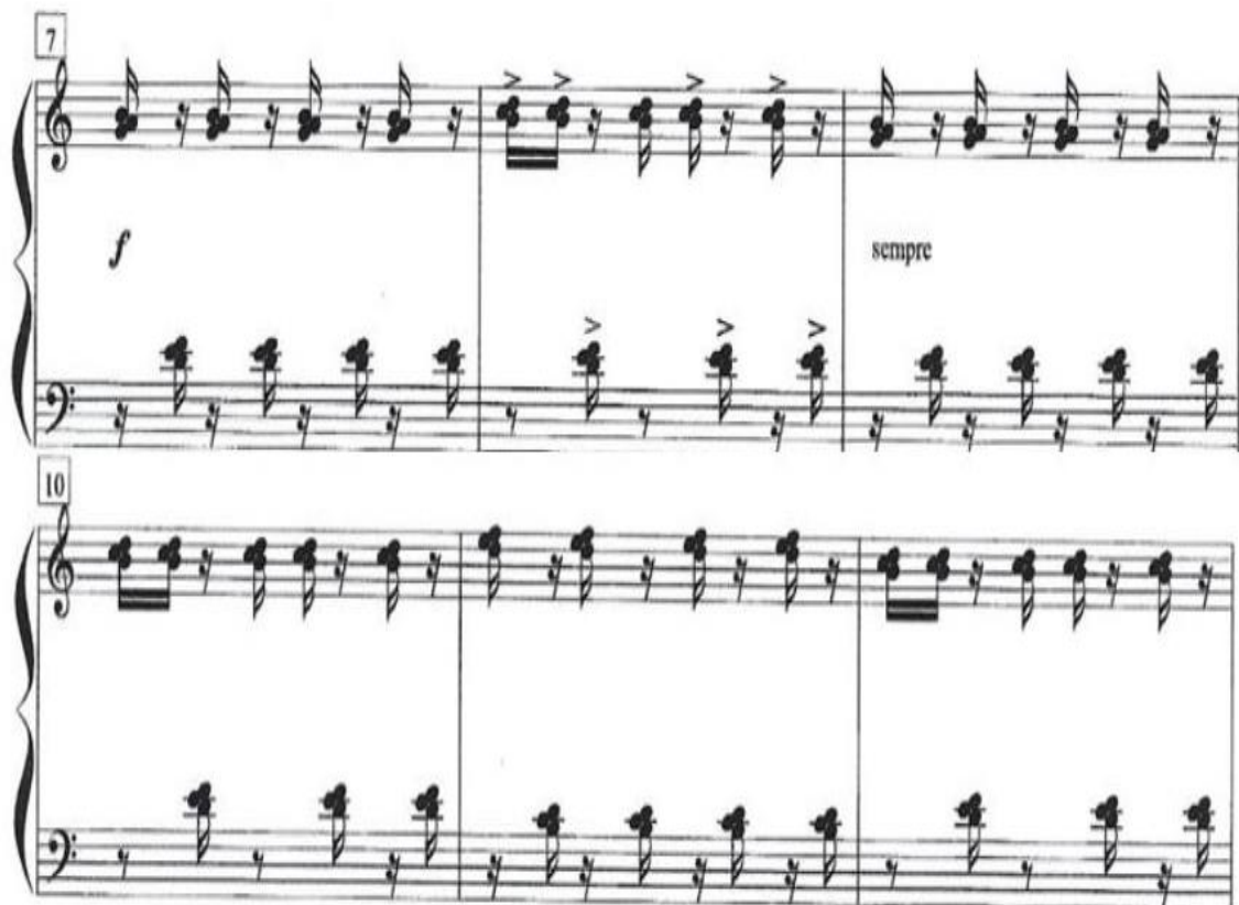
Figura 2 – Parte da música tocada no teclado do piano. Comp. 7 – 1

Fonte: SOARES, C. Sambinha: da "Suíte Juvenil" para Piano, samba, Dó maior; piano. Belo Horizonte: Minas de Som, 2020. Partitura. 3 págs. Disponível em: http://musica.ufmg.br/selominasdesom . Acesso em: 28 de Jun. de 2022.