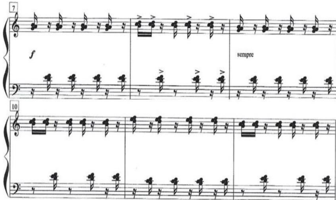
Figura 7 – Exemplo de referência a cuíca. Comp. 7 -12.

Fonte: SOARES, C. Sambinha: da "Suíte Juvenil" para Piano, samba, Dó maior; piano. Belo Horizonte: Minas de Som, 2020. Partitura. 3 págs. Disponível em: http://musica.ufmg.br/selominasdesom . Acesso em: 28 de Jun. de 2022.