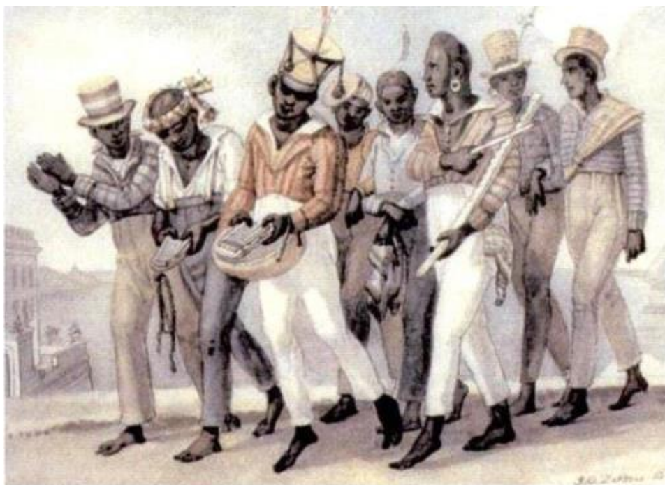
156. Kalimba e reco-reco (pintura de Debret, Brasil, ca. 1834)

Fonte: FRUNGILLO, Mário. D. Dicionário de percussão. 1ª ed. Editora UNESP, 2003. p.369.