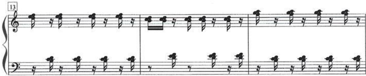
Figura 8 - Compassos 13 – 15