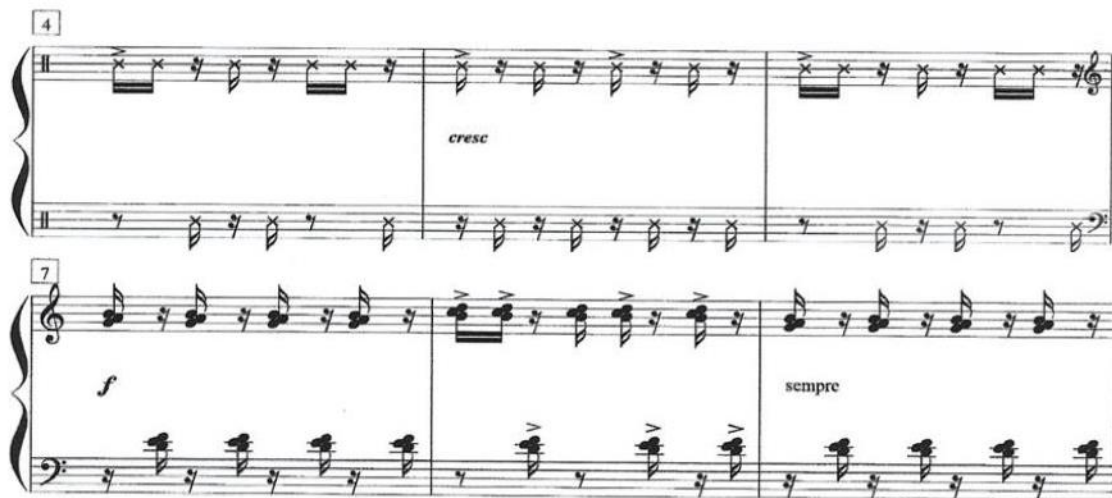
Figura 9 – Exemplo de Ostinato no Sambinha. Comp. 4 – 9