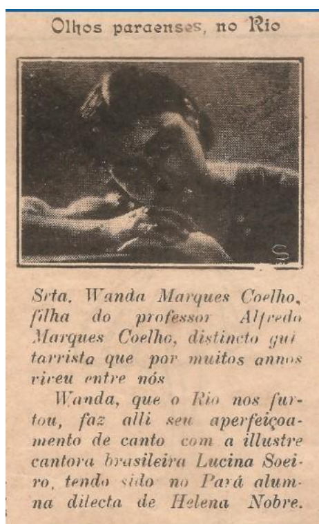
Figura 1- Nota Jornalística do Periódico A SEMANA, Belém, Julho de 1933