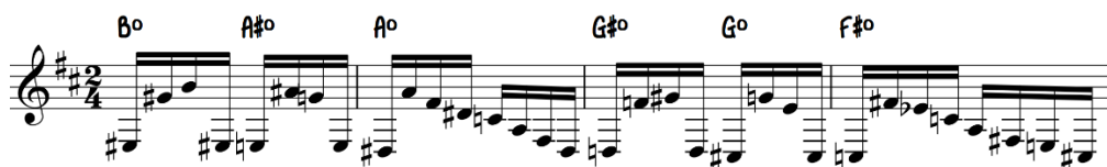
Figura 3 - Caso de sequencia de diminutos em Com mais de mil (início da parte B, compassos 18-21)