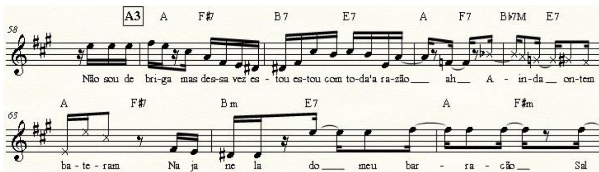
Exemplo 4: Seção A3 após o primeiro refrão. Utilização de elementos da fala junto com a melodia.

No Exemplo 2, Gil estabelece o padrão que vamos usar como parâmetro para comparar com os outros exemplos. O Exemplo 3 já demonstra pequenas mudanças em que ele atrasa certas sílabas como em “bri-ga” e adianta outras como em “A-in-da”. Uma mudança