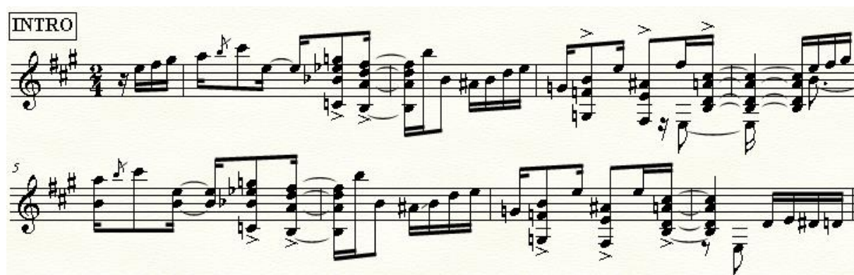
Exemplo 1: Introdução executada ao violão por Gilberto Gil em “Minha nega na janela”.