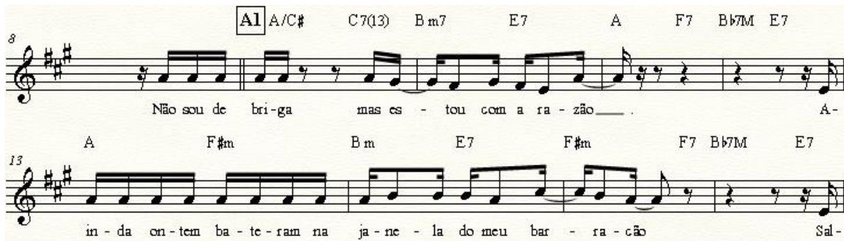
Exemplo 2: Primeira exposição do verso. Estabelecimento do padrão que será modificado nas próximas iterações.

Ao apreciar a execução dos sambas apresentados no show, inclusive esse que estamos analisando, percebemos que, após a primeira exposição da música, Gil passa a variar tanto na melodia quanto no acompanhamento, gerando interesse durante as repetições das seções. Seguem trechos transcritos da gravação do show que demonstram um pouco de tais variações.