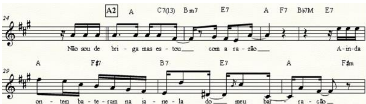
Exemplo 3: Repetição do primeiro verso com variações rítmico-melódicas.