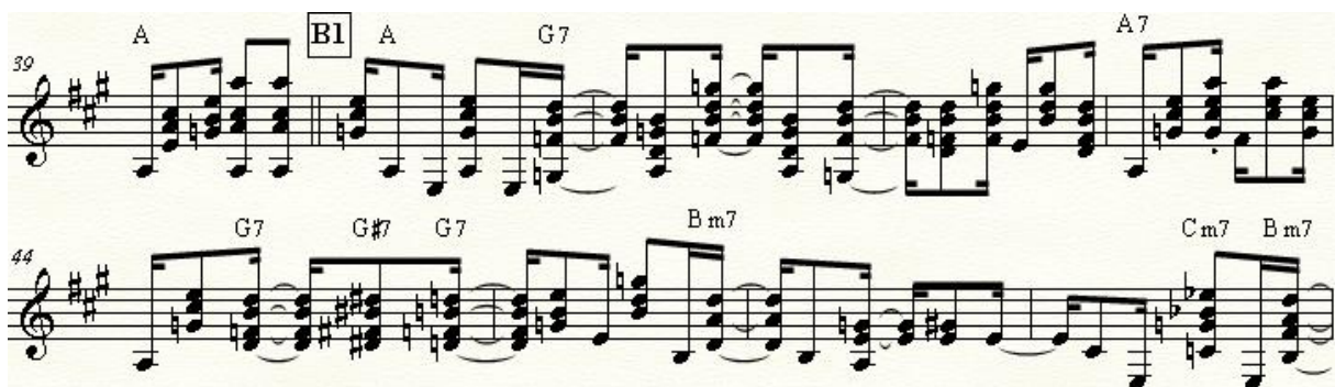
Exemplo 5: Seção B1, primeiro refrão da música.

Não é apenas na voz que Gilberto Gil demonstra habilidades de transformar um material musical durante o andar de uma música. O violão aqui também é digno de nota. Destacando a parte B como ponto mais evidente dessa elaboração que Gil faz, podemos observar um recurso de que ele se utiliza para deslocar o ritmo da canção.